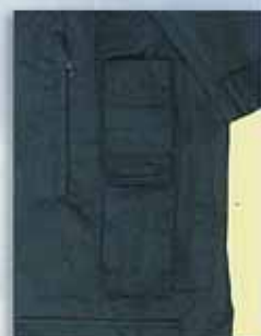
F 無線機用フラップ付ポケット