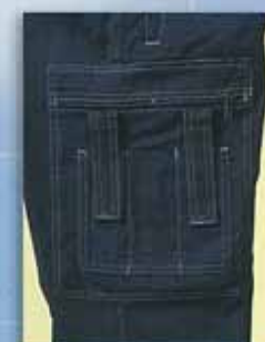
A ズボン 医療用ポケット