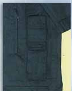
F 無線機用フラップ付ポケット