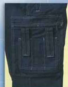
A ズボン 医療用ポケット