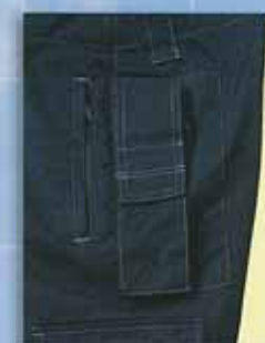
C ズボン 無線機用フラップ付ポケット