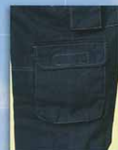
B ズボン 脚サイドフラップ付ポケット