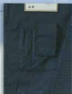
G 携帯電話用フラップ付ポケット