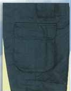
H 脚サイドフラップ付ポケット