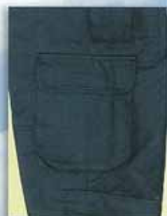
H 脚サイドフラップ付ポケット