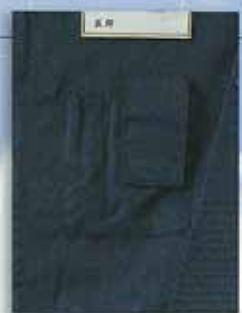
G 携帯電話用フラップ付ポケット