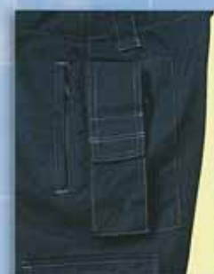
C ズボン 無線機用フラップ付ポケット