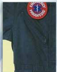
A ファスナー付胸ポケット