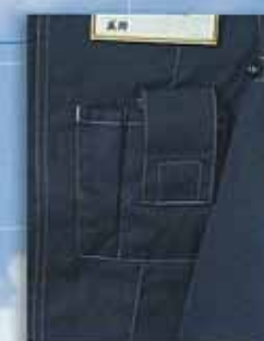
B シャツ 携帯電話用フラップ付ポケット