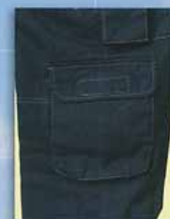
B ズボン 脚サイドフラップ付ポケット